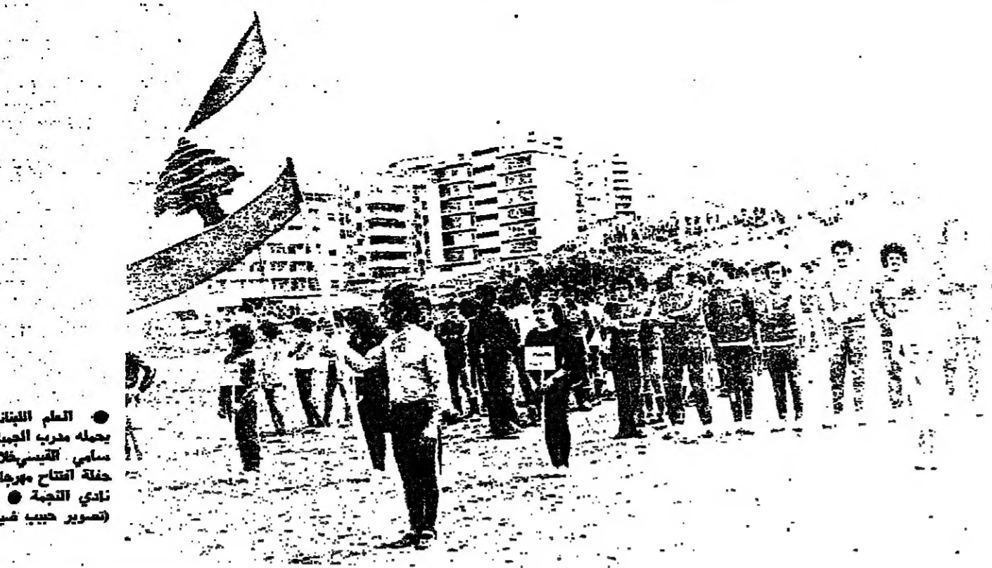
احتفل نادي النجمة قبل ظهر أمس الأحد على ملعبه في الماتية بحضور عدد كبير من المشجعين بترقية خمسة من لاعبيه بكرة القدم لفرقة الأول .